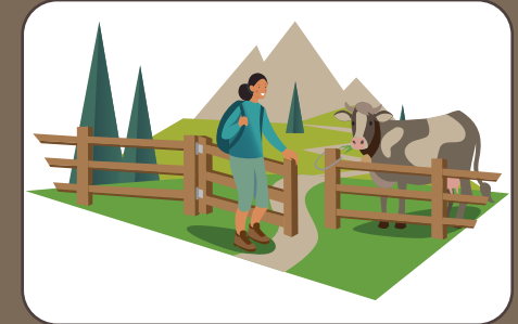
Zaungatter wieder schliessen Richiudere i cancelli | Close the gates