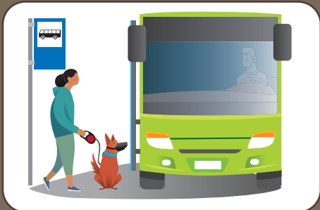
Maulkorbpflicht im Bus und Zug Museruola in autobus e treno | Muzzle in bus and train