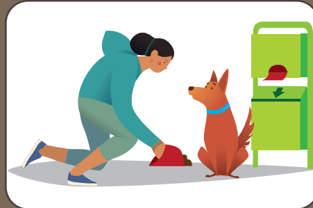
Hundekot aufsammeln Raccogliere gli escrementi | Pick up dog excrement