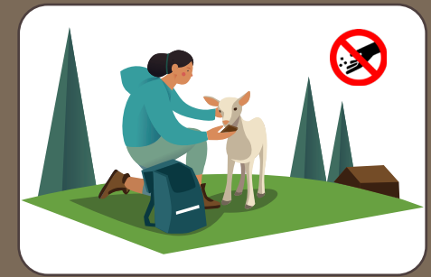
Tiere nicht füttern Non dare da mangiare agli animali | Do not feed animals