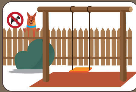
Spielplatz nicht betreten Non entrare nel parco giochi | Don't enter in playgrounds