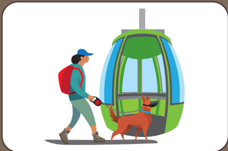
Maulkorbpflicht in Seilbahnen Museruola sugli impianti di risalita | Muzzle on cable cars