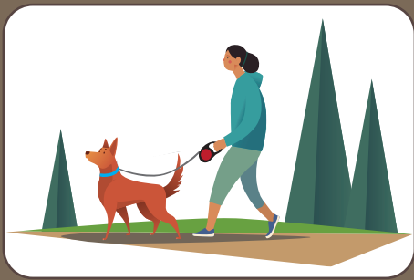
Hund an der Leine halten Cane al guinzaglio | Dog on leash