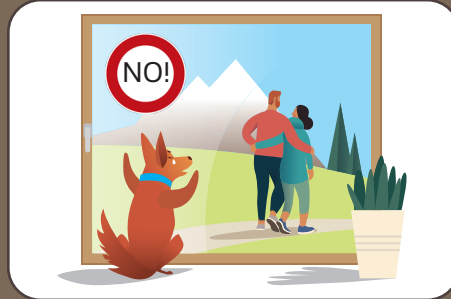
Hund nicht alleine lassen Non lasciare il cane solo | Don't leave dogs alone