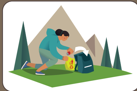
Abfall nach Hause bringen Portare a casa i rifiuti | Take the waste home