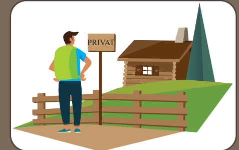
Beschilderungen beachten Rispettare i segnali | Observe signage