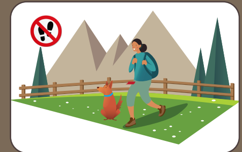
Wiesen nicht betreten Non entrare nei prati | Don't tread on meadows